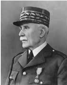
Philippe Pétain (1856-1951), chef de l'État français de 1940 à 1944.

Le 11 juillet 1940, le maréchal Pétain promulgue les trois actes constitutionnels qui fondent le régime de Vichy. Il met fin à la III e République et abolit, du fait de la concentration des pouvoirs au bénéfice de l'exécutif, la démocratie.