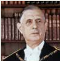
CHARLES DE GAULLE 8 janvier 1959 - 28 avril 1969