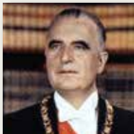
GEORGES POMPIDOU 20 juin 1969 - 2 avril 1974