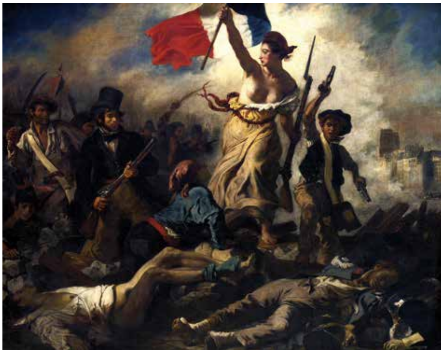
La liberté guidant le peuple, Eugène Delacroix (1798-1863). ●●●●●●●●