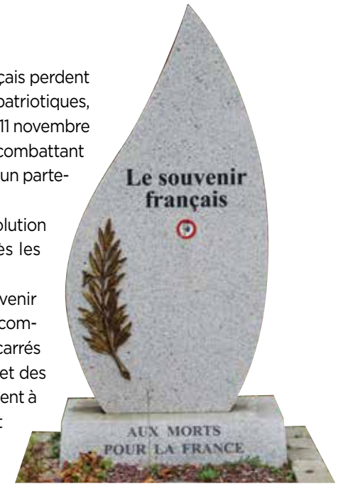
Stèle du souvenir français du monument aux morts de la Première Guerre mondiale de Crécy-la-Chapelle (Seine et Marne).

Le Souvenir Français connaît cependant de fortes évolutions internes au lendemain des décolonisations. Alors qu'il était implanté dans toutes les colonies françaises et en particulier dans les trois pays du Maghreb, Le Souvenir Français se replie en abandonnant sur place de nombreuses tombes de « Mort pour la France ».