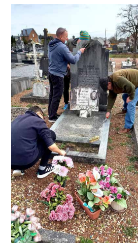
Entretien de tombe.

Cette ambition répond elle aussi à deux défis. Le premier est lié aux journées nationales commémoratives. L'État a créé plusieurs journées nationales commémoratives à la demande d'associations d'anciens combattants et d'associations communautaires.