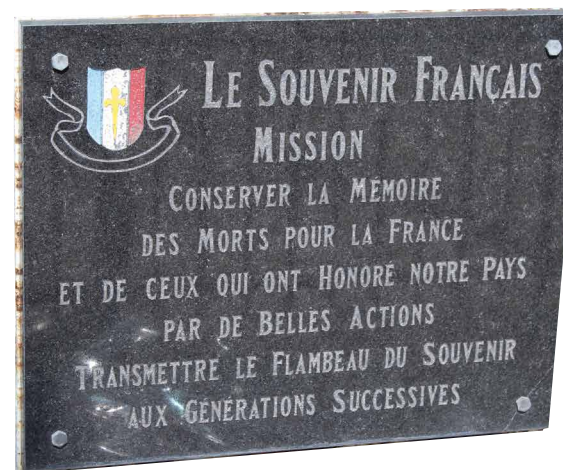
Monument aux morts Neuilly-sur-Marne (Seine-Saint-Denis).

Cette ambition répond à deux réalités. Dans les cimetières communaux, un grand nombre de tombes familiales dans lesquelles sont inhumés des combattants «Morts pour la France» est entré en déshérence tant à cause de la suppression des concessions perpétuelles qu'en raison des déplacements géographiques des familles. Signalées à l'abandon, ces tombes sont supprimées et les restes des combattants rejoignent la fosse commune. Ainsi, paradoxalement, l'opinion publique accorde aujourd'hui plus d'intérêt aux restes de combattants anonymes découverts sur les champs de bataille qu'à ceux de combattants connus inhumés dans les tombes familiales. Parallèlement,