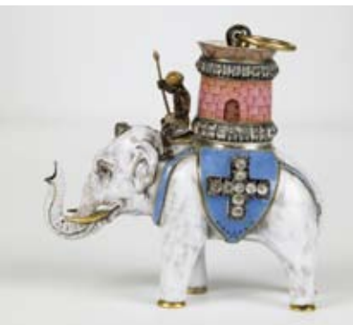
Pendentif du collier de l'ordre de l'Éléphant.