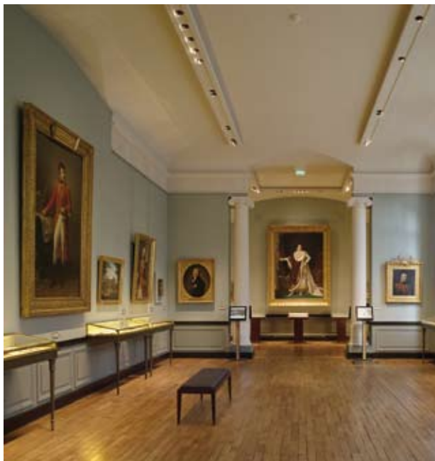
Salle de la Légion d'honneur.

jours. L'histoire de l'ordre de la Légion d'honneur y est racontée depuis ses origines; on y trouve une importante collection d'armes d'honneur, de nombreux souvenirs historiques comme la paire de pistolets et l'épée offerts par Napoléon au tsar Alexandre I er en octobre 1808, lors de l'entrevue d'Erfurt, ou le nécessaire de voyage en argent et vermeil offert à madame Campan, première surintendante des maisons d'éducation de la Légion d'honneur.