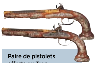
Paire de pistolets offerts au Tsar.