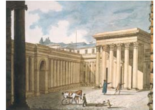
Hôtel de Salm.

Le 11 juillet 1804, un décret impérial institue les signes extérieurs de la Légion d'honneur : « l'étoile », appelée aussi « aigle » : en argent pour les légionnaires*, en or pour les gradés (officiers, commandants, grands officiers), elle est portée à la boutonnière.